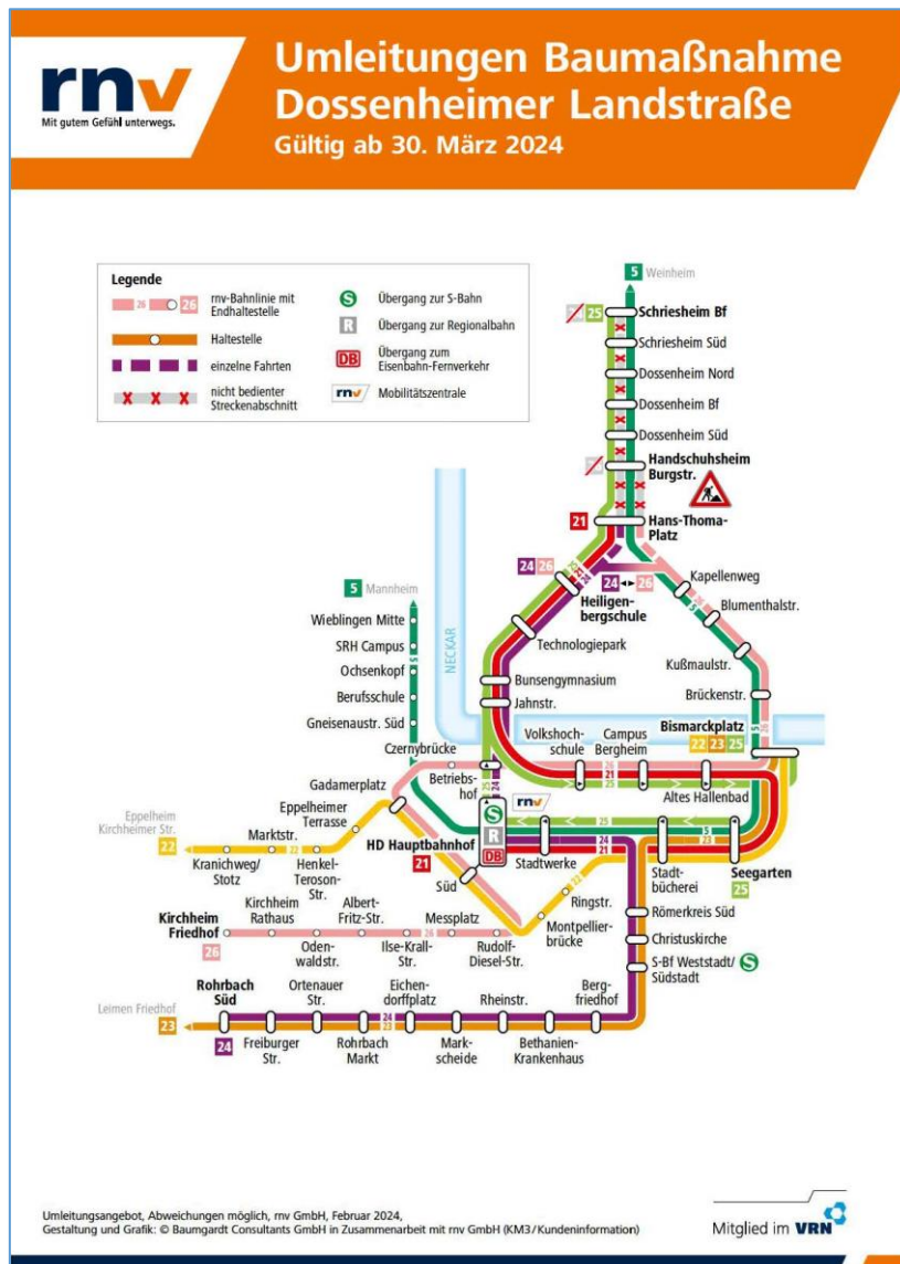
Abbildung 3: Verkehrsführung im ÖPNV während der Bauphasen

Weitere Informationen sind unter der Projektwebsite einsehbar https://www.dossenheimer-landstrasse.de/