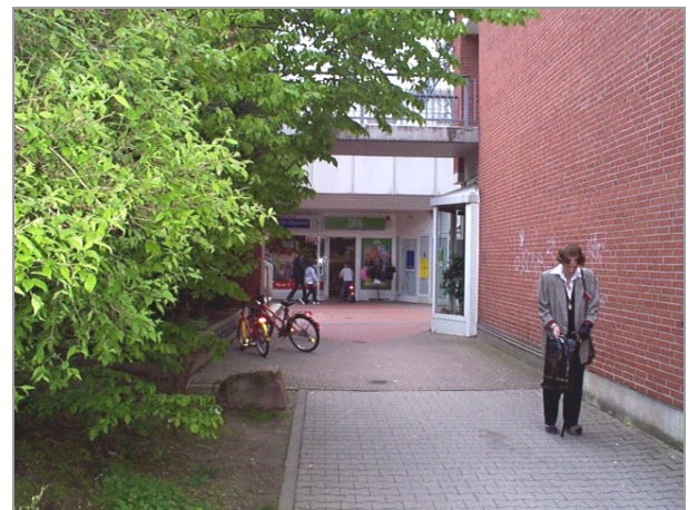
Zugang zum Forum 5