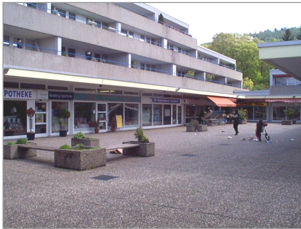
Iduna-Center, Boxberggring 12-16