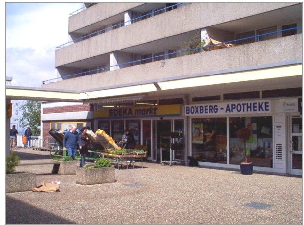
Iduna-Center, Boxberggring 12-16