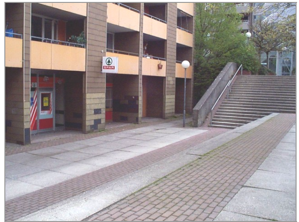
Ehemaliger Spar, Emmertsgrundpassage 22