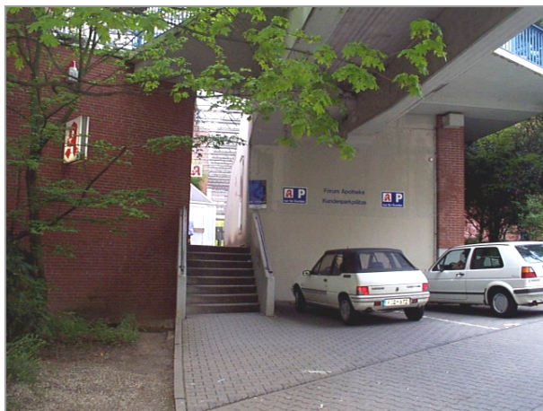
Zugang zum Forum 5