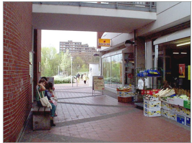
Lebensmittelgeschäft im Forum 5