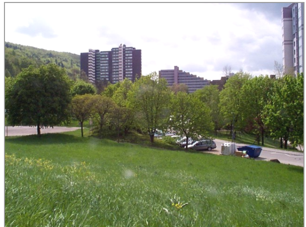
mögliches Ansiedlungsgrundstück – Blick Richtung Emmertsgrund