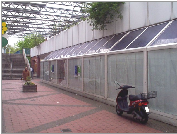
Ehemaliger Edeka-aktiv, Forum 5