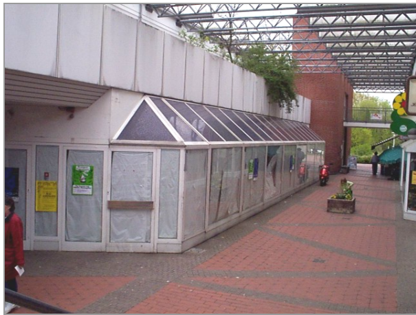
Leerstände im Forum 5